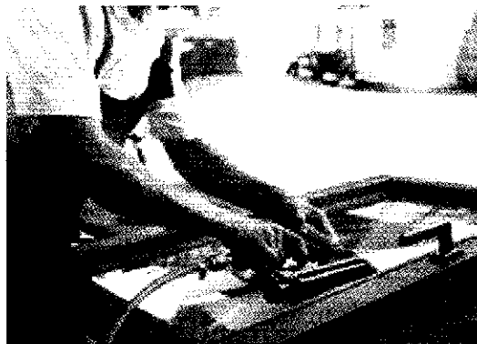
Die Fenster werden direkt vor Ort beim Kunden im Montagewagen saniert.

Das gute alte Holzfenster hat seinen eigenen Charme. Aber ohne Sanierung schließt es oft schlecht. Die Folge: Kühle Zugluft zieht in die Zimmer, wertvolle Wärmeenergie geht verloren und der Schallschutz lässt nach. Hier setzt das bau-ko-Verfahren an. Mit dem Einbau von Spezialabdichtungen können die Holzfenster denselben Qualitätsstandard wie moderne Fenster erzielen. Dabei geht die Sanierung ganz schnell: Facharbeiter hängen das Fenster aus, fräsen in den Überschlag des Fensterflügels eine Nut, bringen dort eine hochwertige Anpressdichtung ein und hängen das Fenster wieder ein. Dies geschieht vor Ort in einem Montagewagen, sodass im Haus kein Schmutz entsteht und kann ganzjährig und bei jedem Wetter durchgeführt werden. Binnen weniger als einer Stunde ist der sanierte Fensterflügel wieder eingebaut. Das Ergebnis: Die